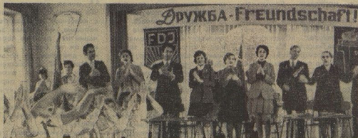
9 мая 1974 года наша газета опубликовала обращение двух пионерских коллективов — дружины имени Олега Кошевого школы № 681 Москвы и школы имени Олега Кошевого Берлина.

На днях дружина имени Олега Кошевого школы № 681 Москвы и школы имени Олега Кошевого Берлина.