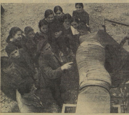
Адмирский колхоз «Хуубуин» награжден орденом Ленина, за доблесть авиационца Героя Социалистического Труда. Гадает авиационными пионерами Хуубуинской средней школы. Многие из них, окончив школу, будут работать рядом со своими прославленными отцами и старшими братьями. Вот почему они уже сейчас с интересом изучают новую технику.