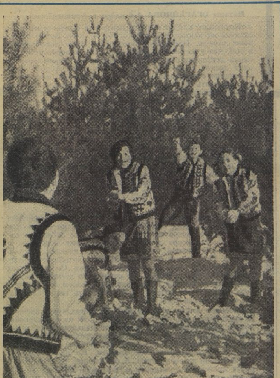
Чукотские ребята ещё долго будут сидеть на нартах, а украинские из Закарпатья проносятся со снегом. Последними снежками радостно перебарываются танцоры из художественной самодеятельности Чернильской средней школы Городеновского района Ивано-Франковской области. Танец всегда остаётся с танцорами, даже если они не на снегу, а просто играют в снежки. Танец в ритме движения, в настроении, в лицах.